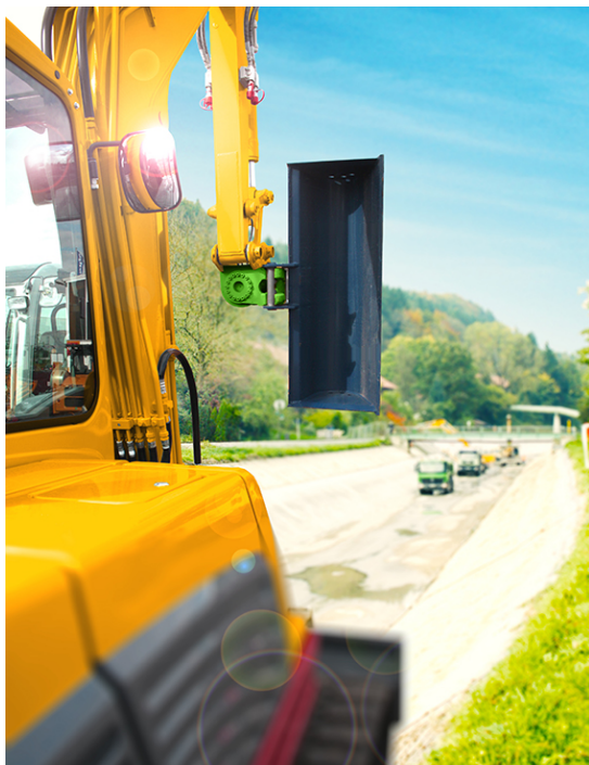
Exakte Positioniertechnik ohne Zylinder für Baumaschinen mit unterschiedlichsten Werkzeugen

Komplett gehärtet und wartungsfrei beweist der XtraTilt von HKS, was Langlebigkeit durch verschleißfeste Bauteile heißt. Alle Bauteile sind oberflächengehärtet und gleichzeitig korrosionsgeschützt, wodurch sich die Lebensdauer der Antriebe um ein Vielfaches erhöht. Zusätzlich dazu wird kein Nachschmieren und Nachstellen benötigt, was die Instandhaltungskosten deutlich reduziert. Dazu ermöglicht ein exaktes Halten der angefahrenen Position und konstante Dreh- und Haltemomente präziseres Arbeiten und verringert so die zu investierende Arbeitszeit. Eine unschlagbare Größenpalette für den XtraTilt und sofortigen, deutschlandweiten Vor-Ort-Service bietet so nur HKS.