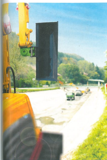
der XtraTilt von HKS

zylinderfreie Schwenktechnik für Baumaschinen. Komplette gehärtet und wartungsfrei beweist der XtraTilt von HKS, was Langlebigkeit durch verschleißfeste Bauteile heißt. Alle Bauteile sind oberflächengehärtet und gleichzeitig korrosionsgeschützt, wodurch sich die Lebensdauer der Antriebe um ein Vielfaches erhöht. Zusätzliche Arbeitsschritte wie Nachschmieren und Nachstellen sind hier nicht mehr nötig, was die Instandhaltungskosten deutlich reduziert. Dazu ermöglicht ein exaktes Halten der angefahrenen Position und konstante Dreh- und Haltemomente präziseres Arbeiten und verringert so die zu investierende Arbeitszeit.